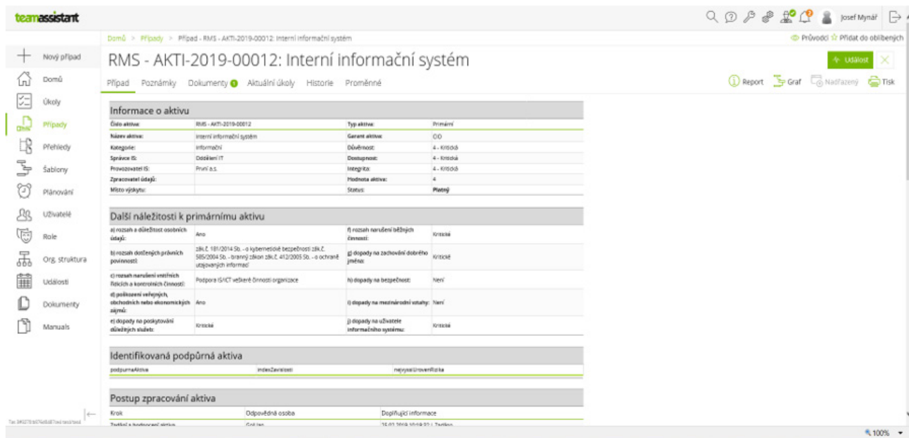
Obrázek 1 – Karta aktivita

Důsledná analýza rizik a realizace nápravných opatření (rozvojové projekty) na jejich základě. Nepřipravené projekty, stejně jako v jiných oblastech, končí neúspěchem.